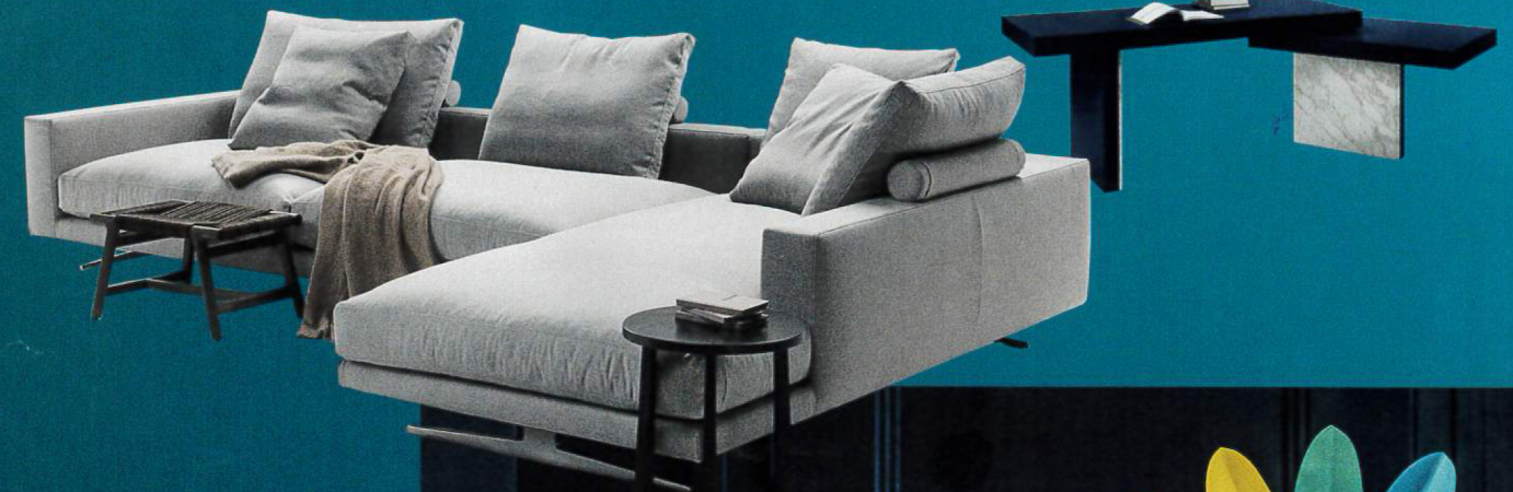
NEUE PERSPEKTIVEN Oben: Antonio Citterio's Sofa „Campiello“ (Flexform) lädt zum Loungen ein, dahinter der elegante Schreibtisch „Benjamin“ von Samuel Accoceberry (Mood by Flexform). Rechts: Federvieh aus Aluminium – ein Hingucker von Antonio Aricò (Altreforme)

Meeresrauschen am Kap der Guten Hoffnung, ein Schmuckkästchen an der Algarve und eine Liebeserklärung an Lausanne